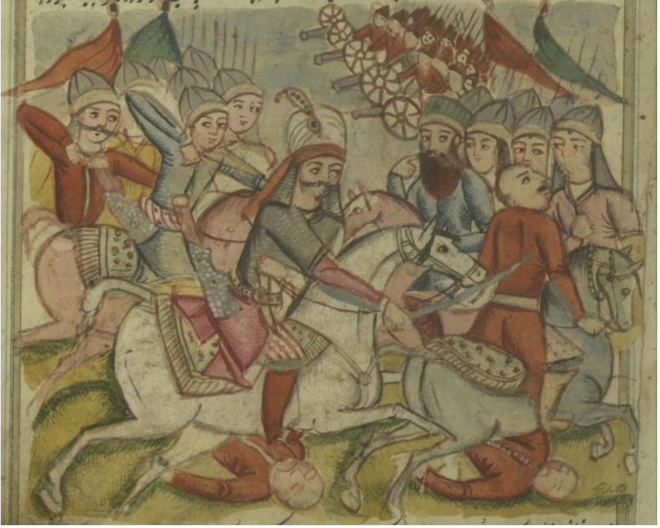
Ek 3. Şah İsmail ile Akkoyunlu Sultan Murad arasındaki savaş Târîh-i 'Âlemârâ-yı Şâh İsmâ'îl, İnan İslâmî Şûrâ Meclisi Ktp., nr. 635, vr. 28a