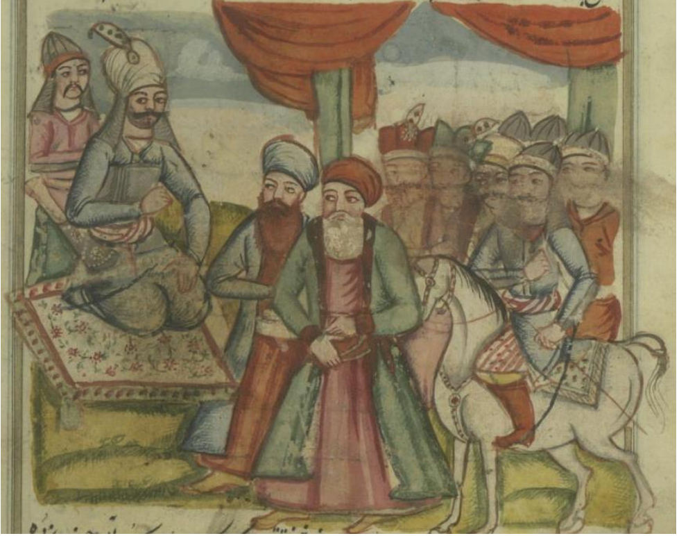
Ek 4. Merv Savaşı'nın ardından Şah İsmail'in kendi ordugâhında devlet adamlarıyla sohbeti

Târih-i 'Âlemârâ-yı Şâh İsmâ'îl, İnan İslâmî Şûrâ Meclisi Ktp., nr. 635, vr. 128b