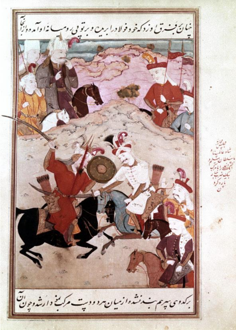
Ek 2. Şah İsmail'in Malkoçoğlu'nu öldürmesi

Târîh-i 'Âlemârâ-yı Şâh İsmâ'îl, Rıza Abbâsî Müzesi, nr. 600, vr. 298b