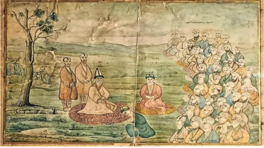
Resim 2. Hacı Bektaş Veli'nin Anadolu'da Kalenderi, Ahi, Yesevi, Babai ve diğere erenler ile buluşmasını tasvir eden temsili tablo Hacı Bektaş Veli Dergâhı meydan evinde sergilenmektedir (www.hacibektasmobil.com) Erişim: 19.12.2023.

Hoca Ahmet Yesevi'nin bu konuda anlatılan aşağıdaki menkıbesi dikkat çekicidir.