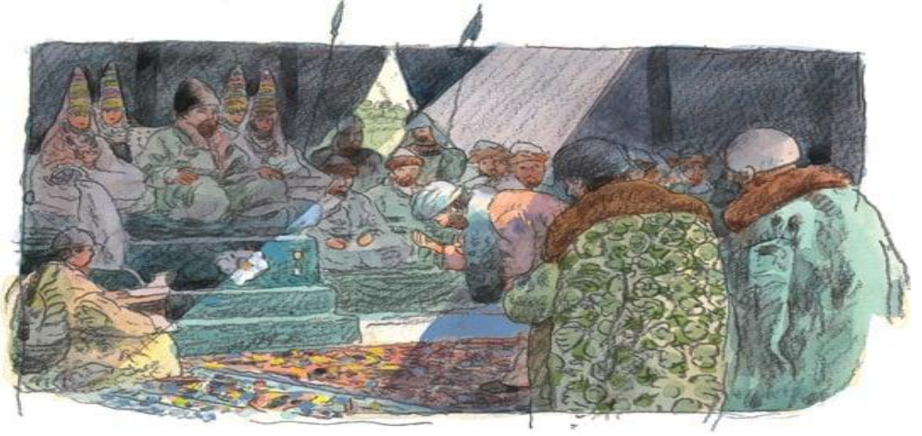
Resim 4. İbni Batuta Altın Orda hükümdarı Özbek Han'ın huzurunda. Tasvirin tahtın yanındaki kadınları gösteriyor oluşu Türklerde devlet protokolünde kadınların yeri bakımından dikkat çekmektedir.

yeniden inşa edilmiştir. Anadolu hakkındaki gözlemlerinde ilginç gelen konuların başında dinin algılanma şekli gelir. Günümüzde olduğu gibi, tek bir İslam'ın pratiğinden söz etmenin mümkün olmadığı bir dönemde İbn Batuta'nın tuttuğu kayıtlar, farklılıkları ve benzerlikleri göstermesi açısından ilginçtir. Bu bakış açısı ile İslam'ın Anadolu'da uygulanmasıyla ilgili olarak, seyyahın ilk dikkatini çeken, gündelik hayatta kadının durumuna dair tespitleridir. İbn Batuta'yı ilk şaşırtan husus kadınların kıyafetleridir. Hayret içerisinde kadınların yüzlerini örtmediğinden ve erkekler tarafından görülmekten çekinmediklerinden bahseder. İbn Batuta'nın bu ifadeleri Anadolu'daki Müslümanlar arasında, kadının sosyal konumunu göstermesi açısından dikkat çekici bir örnektir. Gündelik hayatın içerisinde kadının oldukça aktif bir rol oynadığını göstermektedir. İslam'ın günlük hayata yansımalarıyla ilgili olarak eski Türk töreleri ile İslam dininin emirleri arasındaki uyuma dair örnekleri de görmek mümkündür.